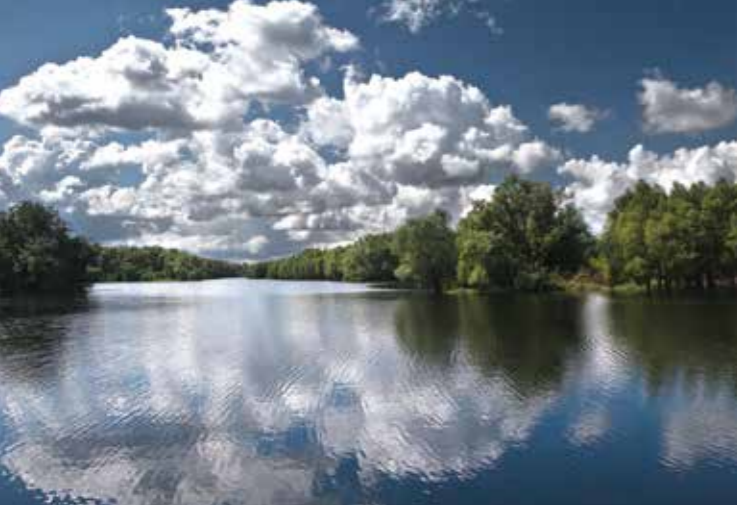
Zoran Alajbeg • KOPAČKI RIT