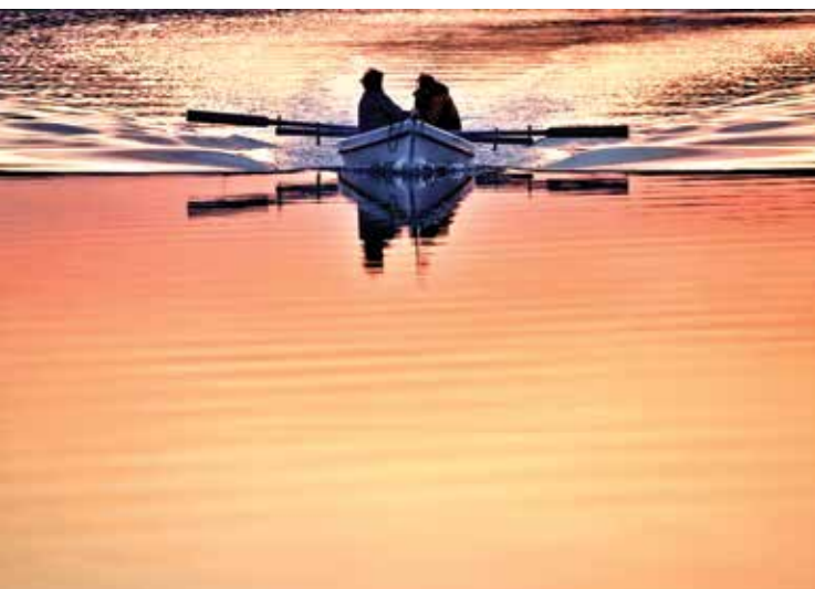
Ratko Mavar • POVRATAK U SUTON