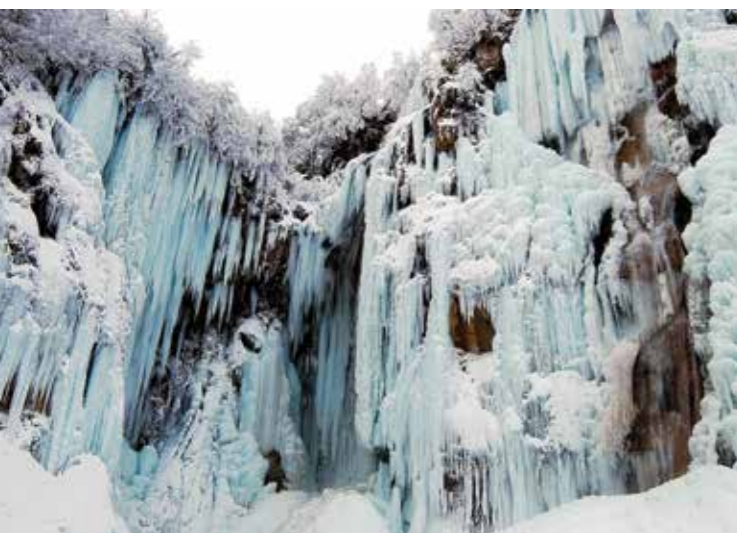
Nenad Reberšak • SLAP