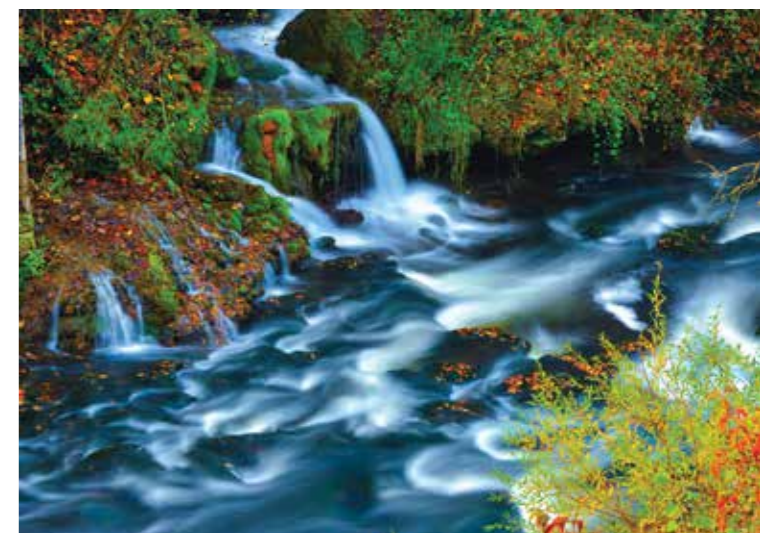
Romeo Ibrišević • VODA 5