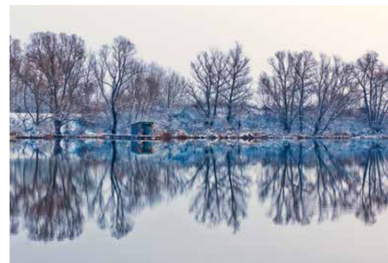
Siniša Uštulica • LONJSKO POLJE