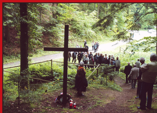
Stratište Lepa Bukva Upis kardinala Josipa Bozanića u spomen.knjigu

Tisuće žrtava, 130 grobnih jama, 1163 ekshumiranih, 21 svećenik, franjevac, bogoslov ■ Molimo za hrvatske mučenike!