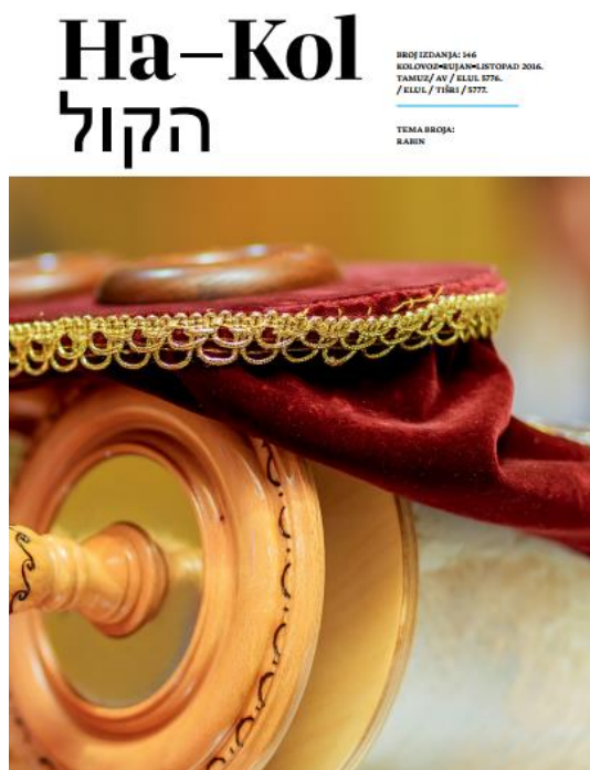
Slika 2 Ha-Kol