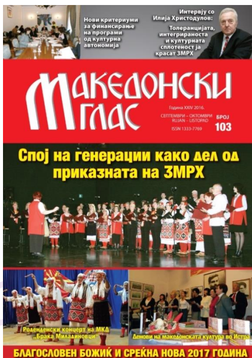
Slika 1 Makedonski glas

Na prvi pogled je vidljivo kako navedeni časopisi uistinu promiču kulturu i običaje svojih naroda, a što se može utvrditi i ako zavirimo u njihov sadržaj. U fokusu su kulturno-umjetnička društva, okrugli stolovi i tribine povezani sa životom pojedine nacionalne manjine, obilježavanje različitih obljetnica i prikazivanje bogatstava nacionalnih manjina.