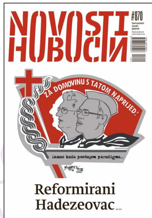
Slika 10 Novosti br. 870