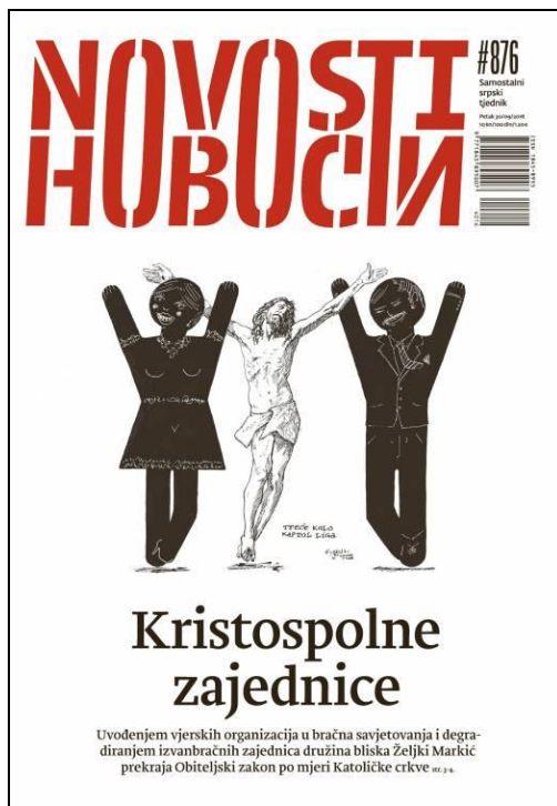
Slika 7 Novosti br.876

Udruga „U ime obitelji“ Zvonimirova 17, 10000 Zagreb, Croatia OIB: 27741674988 tel: +385 1 799 9730 e-mail: info@uimeobitelji.net IBAN: HR5223600001102351957 SWIFT CODE/BIC: ZABAHR2X