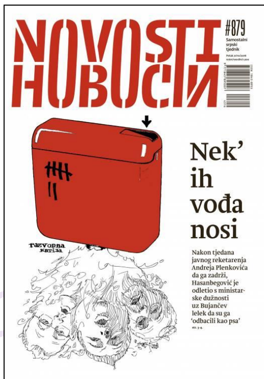
Slika 5 Novosti br.879

Naslovnice su mahom upućene na slanje vrlo provokativnih političkih poruka, kao da je riječ o političkom tjedniku, a ne tjedniku primarno usmjerenom promicanju „etničkog, kulturnog i i jezičnog identiteta“ što natječaj zahtijeva. Štoviše, na mnogim naslovnicama se grubo vrijeđaju vjerski osjećaji većinskog katoličkog stanovništva, čime se krši odredba o promicanju tolerancije, u svrhu čega je tjednik dobio sredstva iz proračuna.