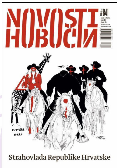
Slika 9 Novosti br. 841