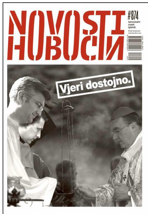
Slika 8 Novosti br. 874