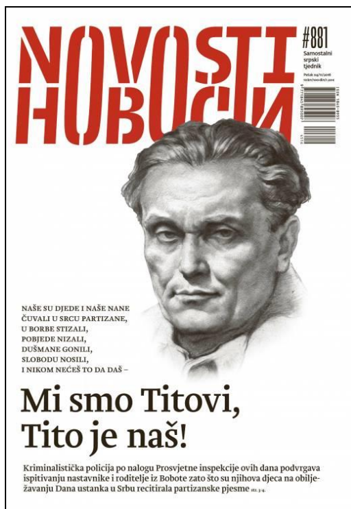
Slika 6 Novosti br.881