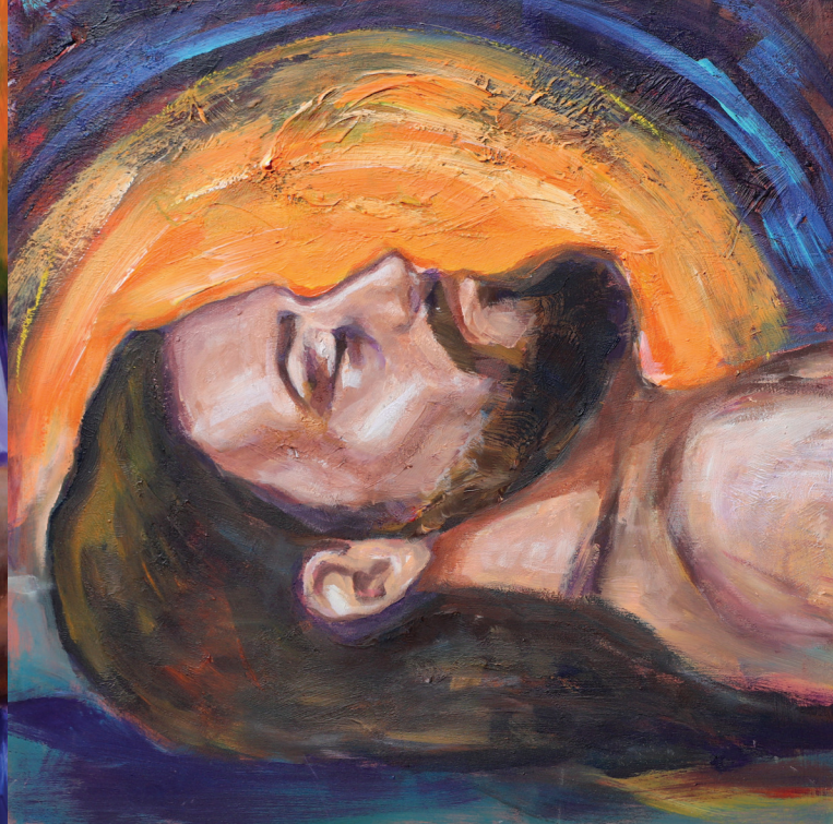
XIV. Isusa polažu u grob

Mrtve hladne ruke... Ni Marijini cjelovi s toplim suzama ih ne mogu ugrijati. Oh, kada će ove ruke ponovno oživjeti? Kada će opet činiti dobro? „Nadoći će drugi križevi, po kojima će drugi umirati u moje ime“