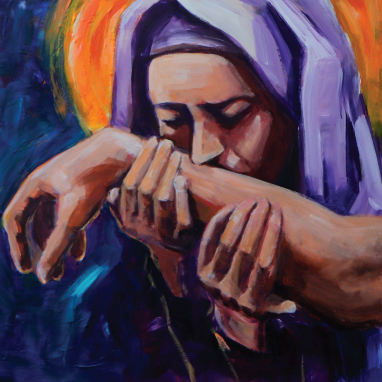
XIII. Isusa skidaju s križa

Mrtve hladne ruke... Ni Marijini cjelovi s toplim suzama ih ne mogu ugrijati. Oh, kada će ove ruke ponovno oživjeti? Kada će opet činiti dobro? „Nadoći će drugi križevi, po kojima će drugi umirati u moje ime“