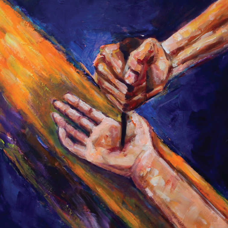
XI. Isusa pribijaju na križ

Koliko su dobra tvoje ruke činile drugima. Ruka čovjeka kojeg si stvorio, kojeg ljubiš, zbog kojeg sve ovo činiš, pribija tvoju ruku.