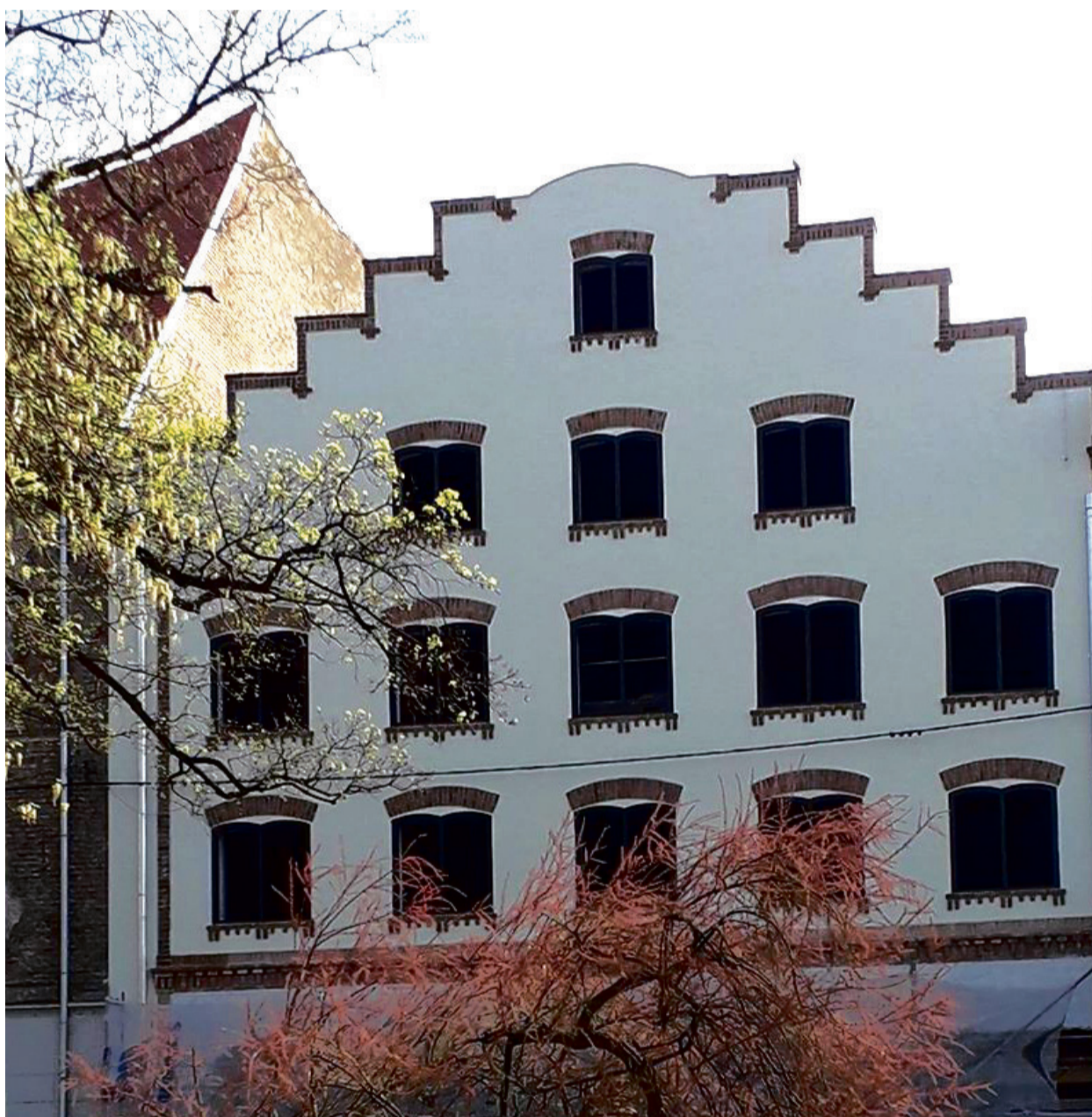
Holandska kuća u Sisku