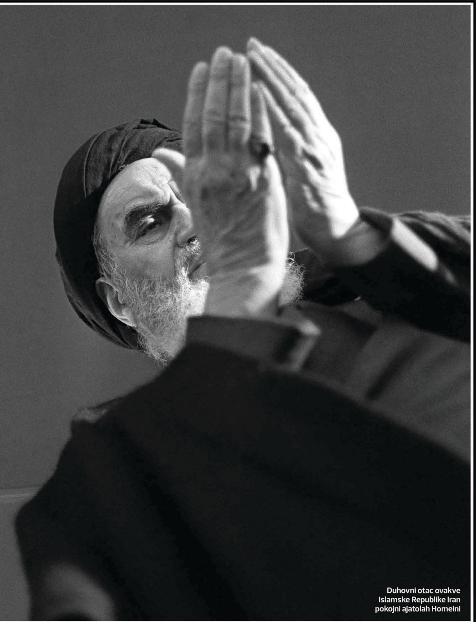
Duhovni otac ovakve Islamske Republike Iran pokojni ajatolah Homeini