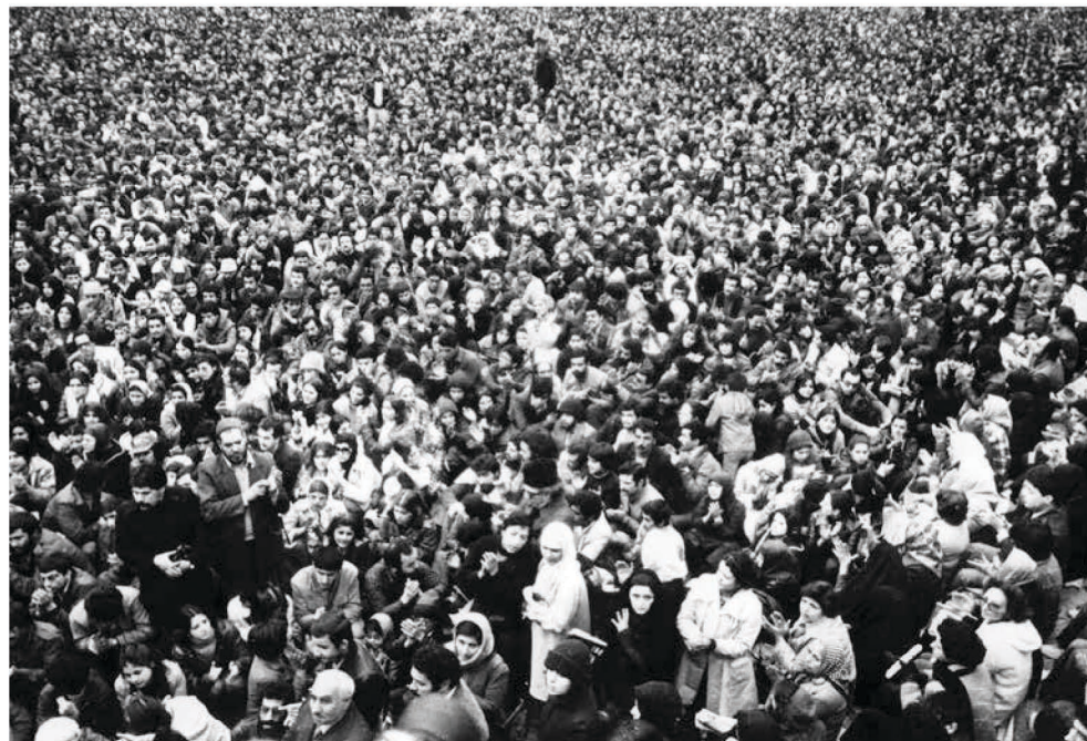
Kult mučeništva ukorijenio se kao jedan od temelja teheranske mulokratske ideologije i svjetonazora

Iran tradicionalno djeluje preko proksija, kako bi sa sebe svratio što više pozornosti, osobito u vrijeme kad nemali dio svojega sankcijama opterećena gospodarstva usmjerava na obogaćivanje uranija. No sredinom siječnja napravio je presedan. Balističkim je raketama napao ciljeve na području Sirije, Iraka i Pakistana, što je svijet podsjetilo kako je iranski arsenal balističkih raketa